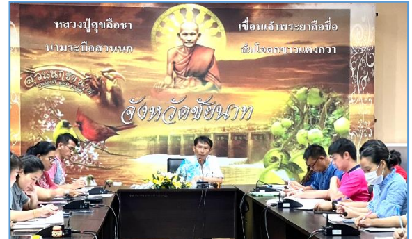
๕) รูปแบบ แนวทาง หรือนวัตกรรม ที่เป็นแบบอย่างที่ดี -ไม่พบ-