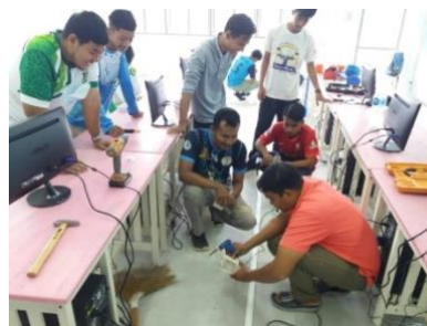
การฝึกทักษะการติดตั้งไฟฟ้าภายในอาคาร