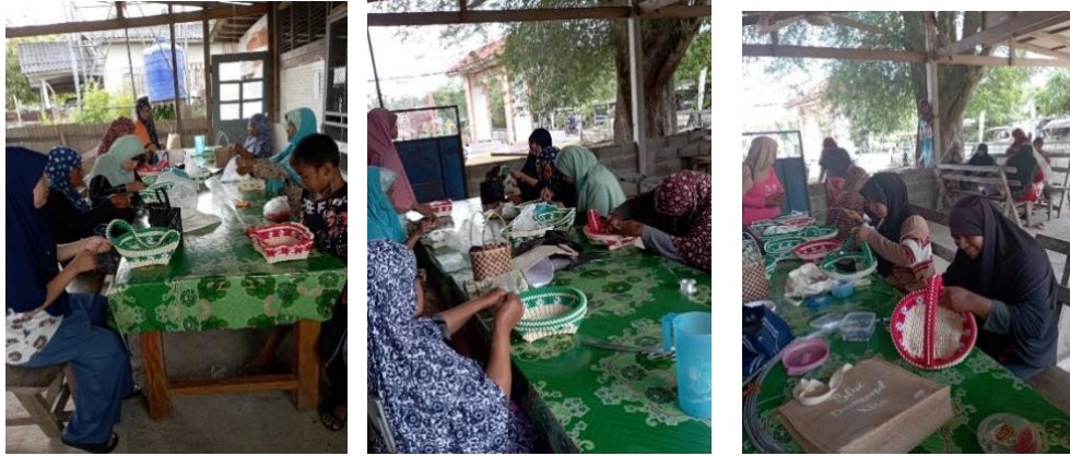
การฝึกอบรมหลักสูตรวิชาชีพหลักสูตรระยะสั้น การทำกระเป๋าลูกปิด

4.3.5 ข้อเสนอแนะในการดำเนินงาน ระดับพื้นที่ (หน่วยงาน/สถานศึกษา)