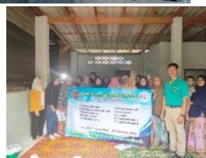
การฝึกอบรมหลักสูตรวิชาชีพหลักสูตรระยะสั้น การทำขนม