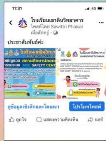
Facebook โรงเรียน