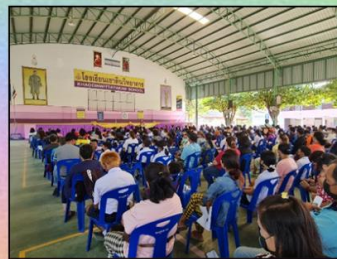
ชี้แจงประชุมผู้ปกครอง