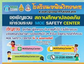
ป้ายประชาสัมพันธ์