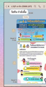
Line ห้องเรียน