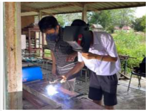
หลักสูตรวิชางานเชื่อมไฟฟ้าเบื้องต้น