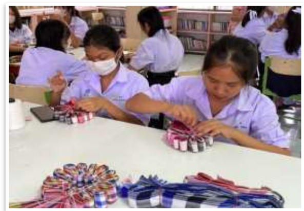
หลักสูตรวิชาจับจีบและผูกผ้า