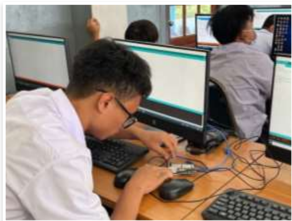
หลักสูตรวิชางานควบคุมอุปกรณ์ไฟฟ้าอิเล็กทรอนิกส์ด้วยสมองกลฝังตัว