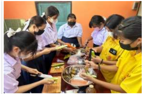
หลักสูตรวิชาอาหารว่างยอดนิยม