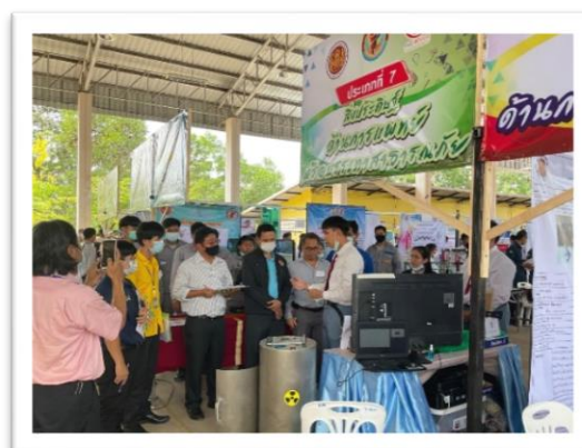
การประกวดสิ่งประดิษฐ์ วิทยาลัยเทคนิคบ้านค่าย