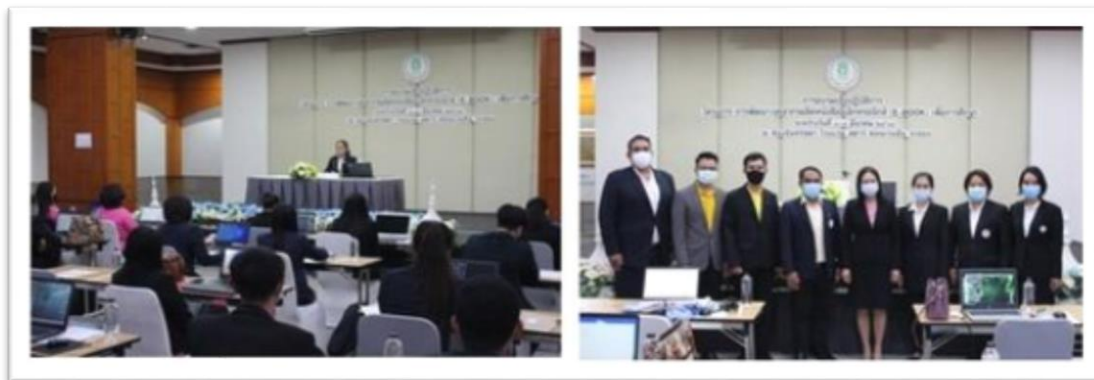
กศน. อำเภอเมือง อบรมเชิงปฏิบัติการตามโครงการพัฒนาบุคลากรผลิตหนังสืออิเล็กทรอนิกส์ เพื่อการศึกษา