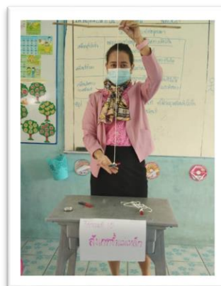
กิจกรรมการทดลองรายวิชาวิทยาศาสตร์ ป.๓ หน่วยที่: ๔ แรงแสนสนุก เรื่อง: สังเกตขั้วแม่เหล็ก

๓) วิธีการแก้ไขปัญหา ที่เกิดขึ้นจากการดำเนินการตามประเด็นนโยบาย