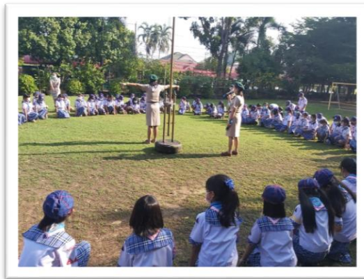
กิจกรรมเปิดกองลูกเสือ เนตรนารี สามัญรุ่นใหญ่ ม.๑-๓