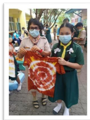
โรงเรียนอารีย์วัฒนา จัดกิจกรรมสีเส้นผ้ามัดย้อมด้วยสีจากธรรมชาติ ระดับชั้นประถมศึกษาปีที่ ๖