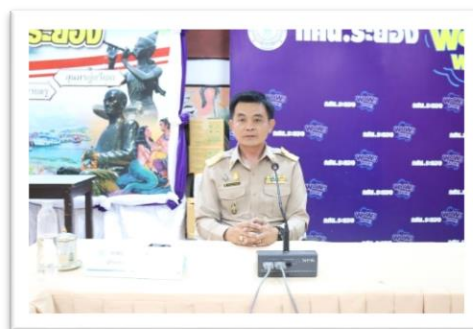
กศน. จังหวัดระยอง จัดทำโครงการพัฒนาครูและบุคลากรสร้างแอปพลิเคชันจัดเก็บข้อมูลสารสนเทศ