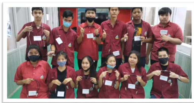
การจัดการเรียนการสอนทวิศึกษาวิทยาลัยเทคนิคบ้านค่าย