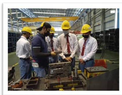
การฝึกประสบการณ์ ณ สถานประกอบการ วิทยาลัยเทคนิคบ้านค่าย