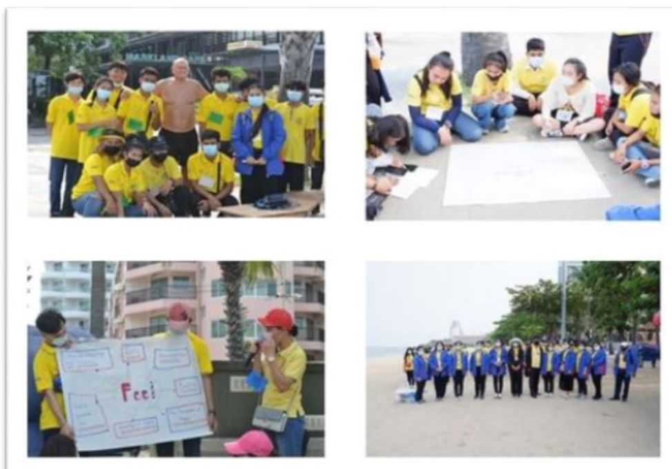
โครงการทัศนศึกษา เพื่อการเรียนรู้สู่โลกกว้าง โดยบูรณาการภาษาอังกฤษ กศน. อำเภอมืองระยอง

กศน. จังหวัดระยองได้จัดทำโครงการและกิจกรรมเพื่อพัฒนาศักยภาพครู กศน. ให้มีความรู้และทักษะใน การจัดการกระบวนการเรียนรู้ที่เน้นผู้เรียนเป็นสำคัญให้กับนักศึกษา กศน. เช่น ออกแบบการเรียนรู้ การจัดการกิจกรรมการเรียนรู้ที่หลากหลาย การพัฒนาและใช้สื่อการเรียนรู้ การใช้เทคโนโลยีดิจิทัลเพื่อจัดการเรียนรู้ การวัดและประเมินผลการเรียนรู้ เป็นต้น ส่งเสริม สนับสนุนให้ครู กศน. ได้รับการอบรมพัฒนาความรู้ ทักษะที่สามารถนำมาใช้และหรือประยุกต์ใช้ในการจัดการกระบวนการเรียนรู้ ในลักษณะต่าง ๆ จัดทำคู่มือแนวทางการจัดการศึกษาขั้นพื้นฐานออนไลน์ เพื่อให้สถานศึกษาและครู กศน. ใช้เป็นแนวทางในการจัดการเรียนรู้ การศึกษานอกระบบระดับการศึกษาขั้นพื้นฐานรูปแบบออนไลน์ และการวัดและประเมินผลการเรียนรู้แบบออนไลน์ และส่งเสริม สนับสนุนให้ครู กศน. นำความรู้ ทักษะด้านเทคโนโลยีดิจิทัลไปใช้ในการจัดการกระบวนการเรียนรู้ให้กับผู้เรียนตามความพร้อมและความเหมาะสม อาทิ การเรียนรู้ผ่านสถานีวิทยุโทรทัศน์เพื่อการศึกษา กระทรวงศึกษาธิการ (ETV) การเรียนรู้โดยใช้สื่อวีดิทัศน์ และยูทูป (You tube) ห้องเรียนออนไลน์ เช่น Google classroom Line Facebook การวัดและประเมินผลโดยใช้แบบทดสอบออนไลน์