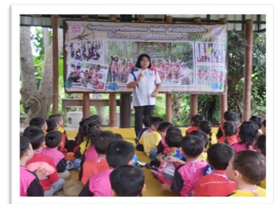
กิจกรรมการจัดการศึกษาเด็กปฐมวัย