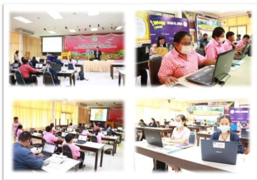
กศน. อำเภอเมือง เข้าร่วมอบรมเชิงปฏิบัติการโครงการศูนย์ดิจิทัลชุมชน หลักสูตรการใช้งานโปรแกรมสำนักงาน เพื่อสร้างโอกาสการมีงานทำ