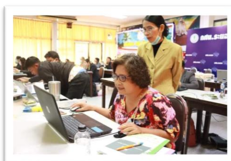
จัดอบรมโครงการศูนย์ดิจิทัลชุมชน หลักสูตรการใช้โปรแกรมสำนักงาน เพื่อสร้างโอกาสการมีงานทำให้กับบุคลากร สำนักงาน กศน. ระหว่างวันที่ ๒๓ -๒๕ กุมภาพันธ์ ๒๕๖๔ ณ สำนักงาน กศน.จังหวัดระยอง