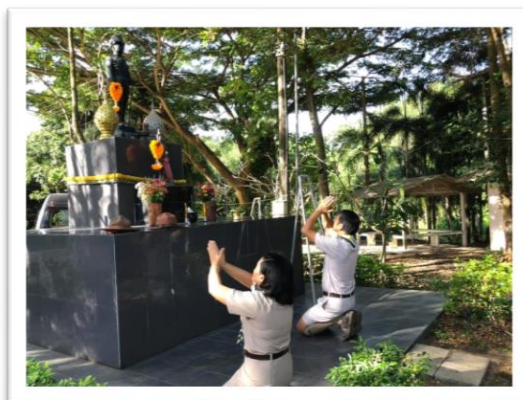
พิธีวางพวงมาลาและถวายราชสดุดี วันสมเด็จพระมหาธีรราชเจ้า ประจำปี ๒๕๖๓ เพื่อน้อมรำลึกในพระมหากรุณาธิคุณของพระบาทสมเด็จพระมงกุฎเกล้าเจ้าอยู่หัว พระผู้พระราชทานกำเนิด ลูกเสือไทย ณ ลานพระบรมรูปรัชกาลที่ ๖ โรงเรียนอุดมวิทยานุกูล และ ค่ายลูกเสือกัญฉิม