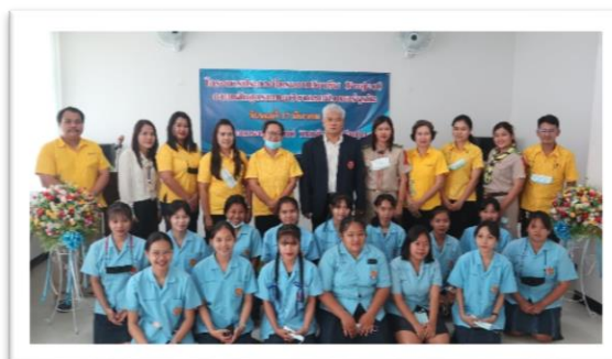
โครงการประกวดโครงงานวิชาชีพ ตามหลักสูตรแผนวิชาคอมพิวเตอร์ธุรกิจ วิทยาลัยเทคนิคบ้านค่าย