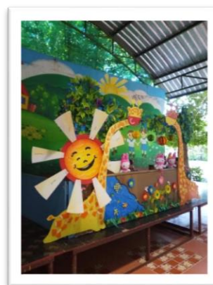
กิจกรรมผู้บำเพ็ญประโยชน์(นกน้อย) ระดับชั้นอนุบาลปีที่ ๑-๓ โรงเรียนอารีย์วัฒนา